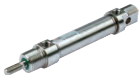
Vérins en acier inoxydable suivant la norme ISO 6432 diamètres du 16 au 25 mm