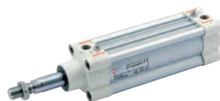
Vérins série HCR (High Corrosion Resistance) suivant la norme ISO 15552 diamètres du 32 au 125 mm