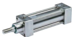
Vérins en acier inoxydable suivant la norme ISO 15552 diamètres du 32 au 125 mm