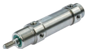
Vérins ronds en acier inoxydable diamètres du 32 au 63 mm